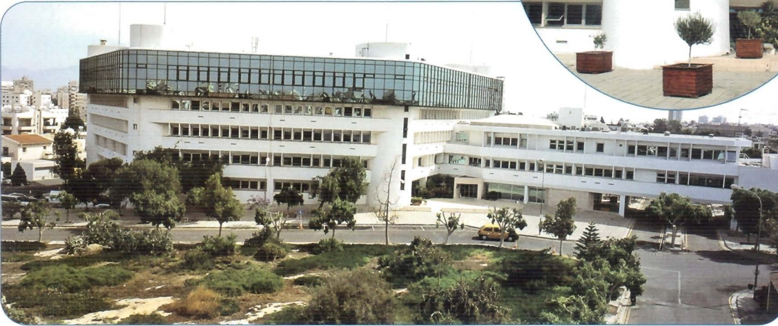
• هيئة الاتصالات السلكية واللاسلكية في قبرص - نيقوسيا، قبرص

وقد أدى هذا السعي إلى اعتراف المؤسسة الأوروبية لإدارة الجودة بامتياز الهيئة.