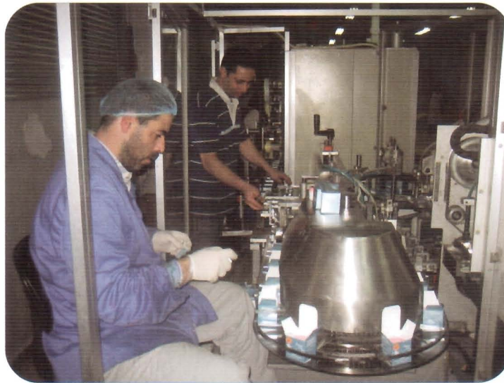
• التعلب الأوتوماتيكي في ديانا دي بوتي

في النهاية، عبّر برغل عن بالغ سعادته بدعوة برنامج الجودة شركة ديانا إلى المشاركة في مشروع المنظمة العالمية للمواصفات مقدراً كل وسائل الدعم والخبرة التي وفّرها لها.