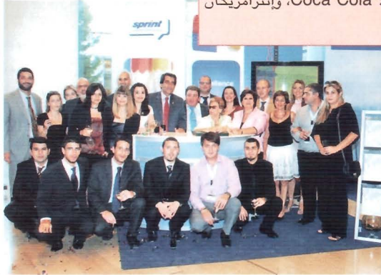
• سبرنت ش.م - مجموعة أثينا

الأشخاص - سعينا إلى تطوير وإطلاق العنان لقدرات موظفينا على المستوى الفردي والجماعي والمؤسسي. وحرصنا على تخطيط وإدارة وتحسين مواردنا، وتحديد وتطوير معارفهم ومهاراتهم، وتقديرهم ومكافأتهم على جهودهم.