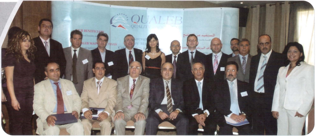
• صورة جماعية في حفل توزيع الجوائز

أقام برنامج الجودة في وزارة الاقتصاد والتجارة الممول من الاتحاد الأوروبي حفلاً أوروبياً، ممثلة برئيس بعثة المفوضية الأوروبية في لبنان السفير باتريك لوران، على توجيهاتهما ودعمهما للبرنامج مشدداً على ازدياد عدد الشركات الراغبة في الانضمام إلى نشاطات البرنامج في مرحلته الثانية.