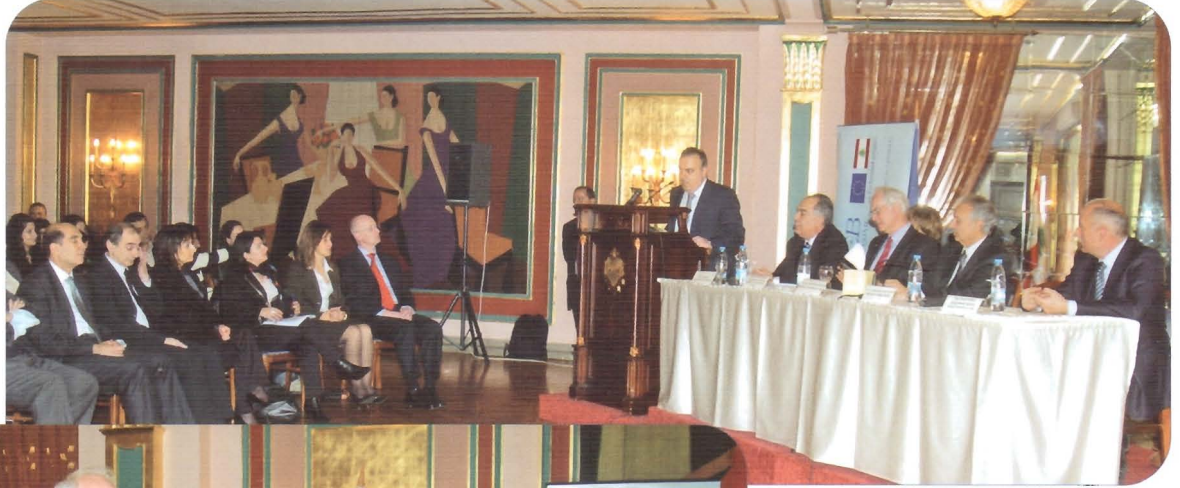
• معالي وزير الصحة د. محمد جواد خليفة متكلماً

انتفاء الجودة الذي يقود إلى انعدام الفعالية وتكاليف إنتاجية أعلى، يؤديان بدوريهما إلى نفاذ محدود إلى الأسواق، وكميات مبيعات أقل، وعدم رضا المستهلك، وخسارة المستهلكين، بالإضافة إلى مخاطر