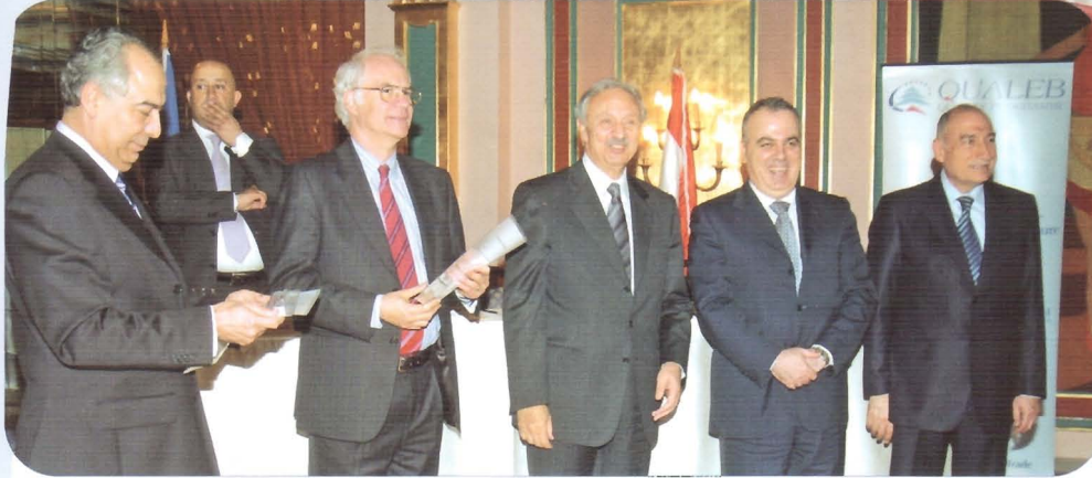
• تسليم الشهادات (من اليمين) فؤاد قليفل، معالي الوزير خليفة، معالي الوزير الصفدي، السفير باتريك لوران وعلي برّو

أما معالي وزير الصحة العامة محمد جواد خليفة، فقد علق على تنفيذ المشروع المرتبط بالنوعية الذي يركز على الخدمات الاستشفائية والسلامة العامة، حيث أنجزت ثلاث مراحل تقود إلى خدمات استشفائية ونشاطات طبية أفضل. كما أشار إلى أن عمليات تدقيق خارجية سوف تستمر من أجل مراقبة مراحل التنفيذ، إذ يلعب لبنان دوراً طليعياً في أرجاء المنطقة العربية في كلٍّ من مجالي الخدمات والنشاطات الطبية - وتابع معاليه: "في حقبة العولمة والنفاذ إلى السوق، أصبحت مواصفات الجودة وآليات التنفيذ الضامنين الأساسيين للحفاظ على صحة المستهلكين في الوطن، فيما تؤمن، في الوقت ذاته، حماية المعايير العالية المتوفرة والمكانة العالية المدركة في السوق".