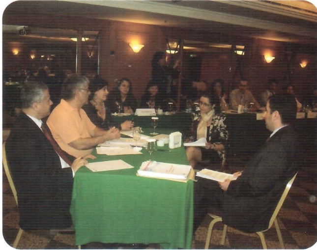
• حلقة جماعية خلال الدورة التدريبية لمحكمي الجائزة اللبنانية للإمتياز

إن يحذو برنامج الجودة حذو العديد من الدول الأكثر تقدماً في العالم والدول الـ ٢٧ العضوة في الاتحاد الأوروبي، أطلق البرنامج مبادرة لدعم القدرة التنافسية لمجتمع الأعمال، من خلال إعداد نموذج لبناني لإدارة الجودة وتنفيذه، وإعداد الجائزة اللبنانية للإمتياز وتنفيذها. وسيساعد نموذج إدارة الجودة اللبناني المدراء على تطبيق ممارسات الإدارة المنهجية، كما سيؤدي استخدامه الفعال إلى نيل الجائزة اللبنانية للإمتياز كخطوة تالية.