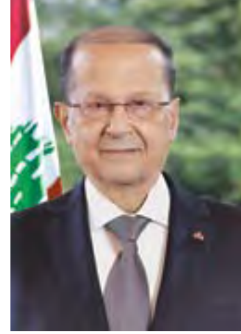
العماد ميشال عون رئيس الجمهورية اللبنانية