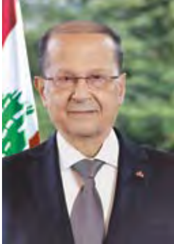
H.E. THE PRESIDENT OF THE LEBANESE REPUBLIC GENERAL MICHEL AOUN