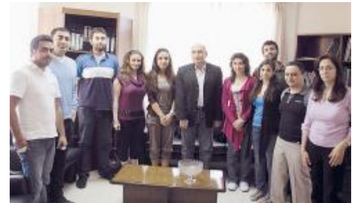
المشاركون في الدورة التدريبية التي اقيمت بالتنسيق مع حكومة الظل الشبابية

كثّف الخبراء المعتمدون من قبل المديرية إطلاقاتهم الإعلامية على كافة القنوات اللبنانية للإضاءة على إطلاق هذه النشرة الإلكترونية وتعريف المستهلك الى كيفية الحصول عليها.