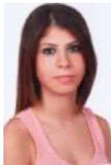
صورييل خريش مراقبة مساعدة

أن المايكرويف غير قادر على قتل السالمونيلا وغيرها من البكتيريا في حال تكاثرها في اللحمة النيئة. إن بعض البكتيريا مثل Staphylococcus aureus and Bacillus cereus تفرز سموما في الطعام نتيجة تركه خارج الثلاجة لا يمكن لأي حرارة أن تقضي عليه أو تجعل استهلاك هذا الطعام آمناً من جديد.