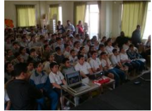
خلال محاضرة اعطيت داخل قاعة احدى مدارس بيروت

سعيًا الى نشر الوعي الثقافي فيما يتعلق بمفهوم حقوق وواجبات المستهلك، بدأت مديرية حماية المستهلك منذ مطلع العام ٢٠١٠ بحملات توعية عبر التعاون مع المؤسسات التربوية وخاصة المدارس في محافظتي بيروت وجبل لبنان وذلك بإقامتها سلسلة من المحاضرات التوعوية تهدف الى شرح حقوق المستهلكين وتحفيزهم للحفاظ عليها والمطالبة بها والتعريف بالخط الساخن ١٧٣٩ وتفعيل دوره في هذا المجال. وقد زرنا ما يزيد عن ١١٠ مدارس خلال العام الدراسي ٢٠٠٩-٢٠١٠، وستستمر الحملة في العام المقبل على أن تشمل بقية المحافظات في أقرب وقت ممكن.